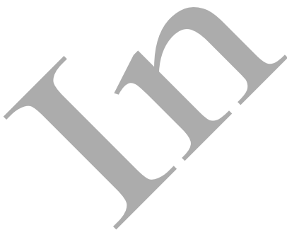
تصوير صفحه آخر نسخه

کشم اورا کوبن چنان کو اوشانی ای سر د گفت در ابرو معکف است زان زمین کی سحر توان کرد سیل کوبینک را بگرداند مثل سایزت عالم کرد سفر حاج آنما که بکوز کی زبونت کوزند کخسته تنان و که نکوت کوزند همچون شش طرخ میازی با بی بر جا که در آبی برونت کوزند فرد چون خت تیره کشیش شرح چون عقل خیره مانده بودن فرد جوتن شود مرد در روز کار به آن کند کش نیاید بکار فزون بود من ز موان روز سر عیب کرد و جوشد خت شود فرد کوز کوه کیری نمنی بجای سر نجام کوه اندر آید ز باقی کمال ای ادکلاف می زنی از آن عاق طونه کل زبان تو بادل بولوت مدح زانکه که عشقت تطاول در کرد معلوم شد که عقل نذر در کفایتی از ترقی در باب فرزند نافه مگو شدیم که تو ما زیم کسی نتوانستیم و جهد کردیم بسی سروی توان پناخ بختت حسی تور دوستی بری و ما دوستی شعری آنکه او نام دتنگ خود بکشد دل تو چون نکا خوار بکشد کمال مرادوستی گفت قانع شوی مار که هموار عیان بود مرد طامع قناعت نکو باشد آری و این هم آخر حمزی توان بود قانع امامی با دیر خویش روی در روی آرد چون آینه که پشت رسم کند