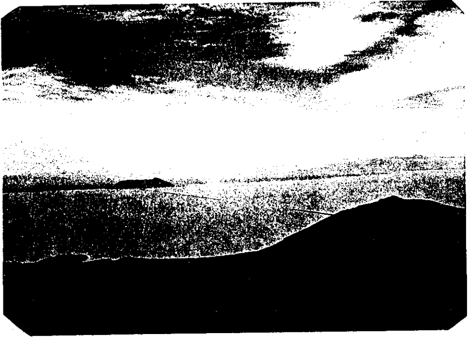
دریاچه اورمیہ از فراز جزیرہ شاهی (اسلامی فعلی)