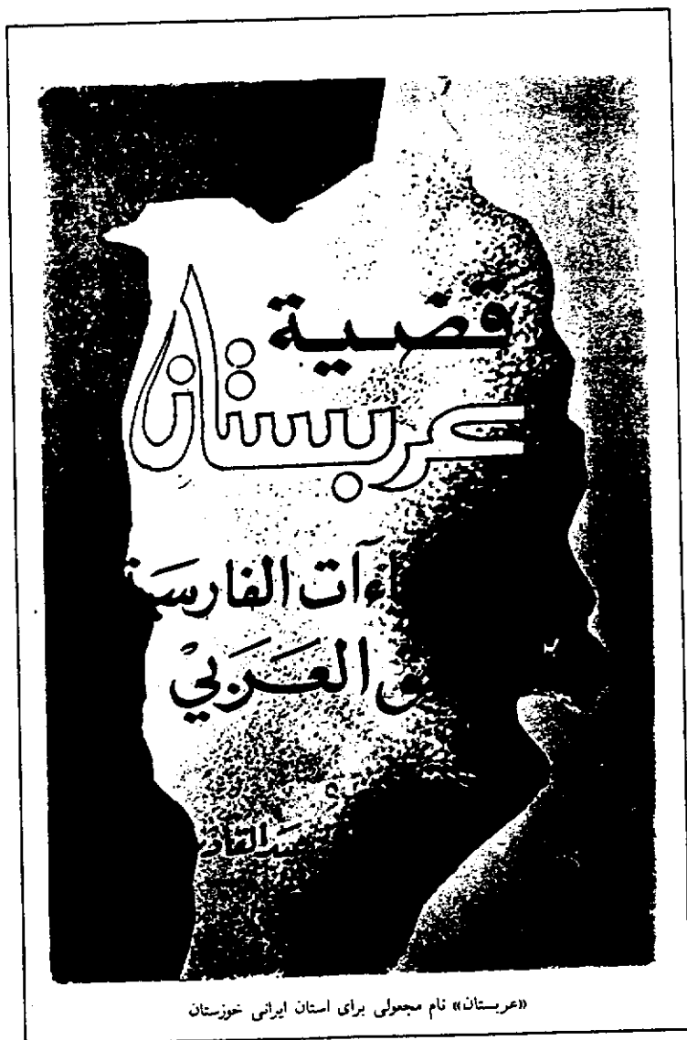
«عربستان» نام مجعولی برای استان ایرانی خوزستان

مأخذ: اصغر جعفری ولدانی: بررسی تاریخی اختلافات مرزی ایران و عراق